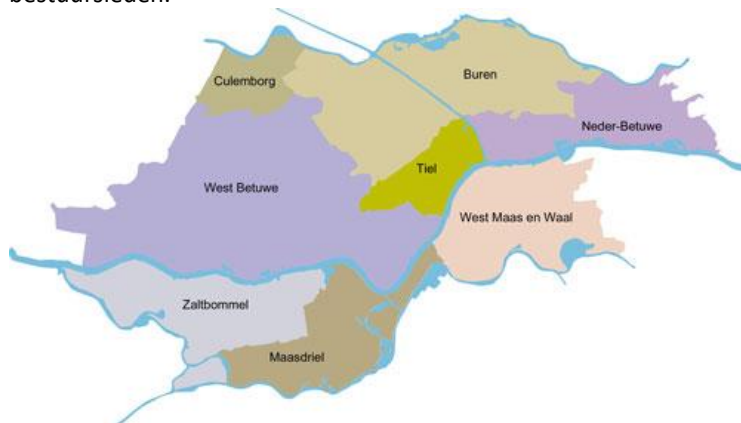
Figuur 1 Het werkgebied van de Stichting Rivierenland